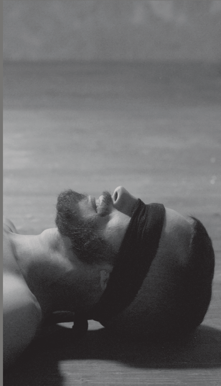
Mundo invertido (2016) Con: Stefano Laforgia, Carlos Motta, Andrea Ropes Video, sonido, color, 7:39 min