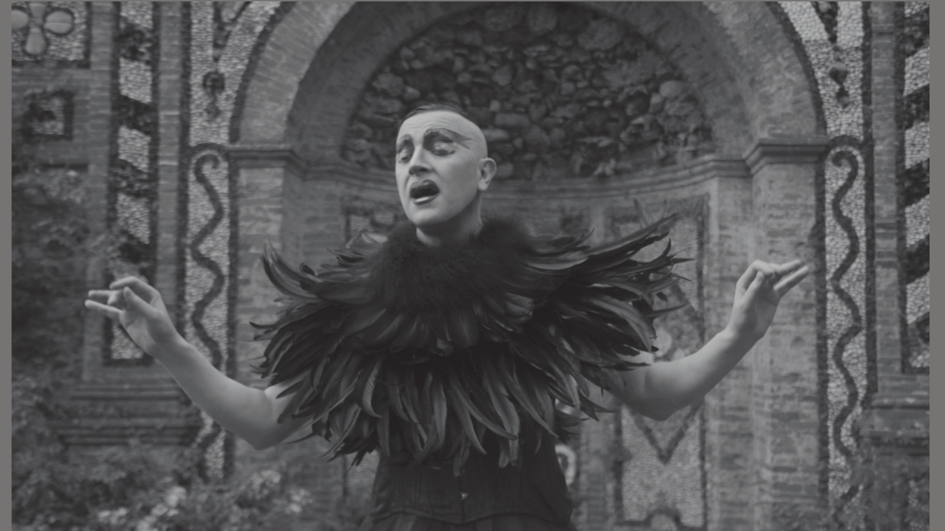
Libera me (2016) Con: Ernesto Tomasini Música: "Libera Me" del "Requiem" de Gabriel Fauré Video, sonido, blanco y negro, 2:30 min