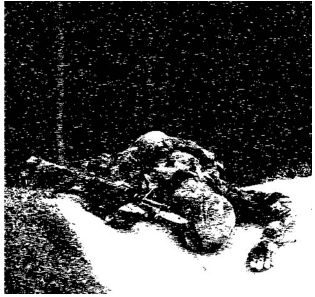
Black and White Pain-ting # 14 , 2006. From SOA: Black and White Tales , 2006. Dimension variable, archival inkjet on canvas. Pinturas en Blanco y Negro #14 . De la serie SOA: Historias en blanco y negro , 2006. Dimensiones variables, impresión chorro de tinta sobre tela, calidad de archivo.

form of this newsprint became the main characteristic that Motta's future installation challenged.