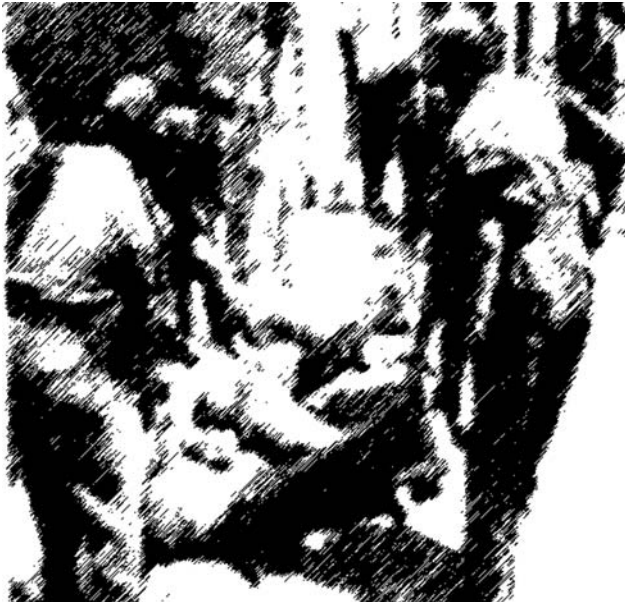
Black and White Pain-ting # 3 , 2006. From SOA: Black and White Tales , 2006. Dimension variable, archival inkjet on canvas. Pinturas en Blanco y Negro #3 . De la serie SOA: Historias en blanco y negro , 2006. Dimensiones variables, impresión chorro de tinta sobre tela, calidad de archivo.