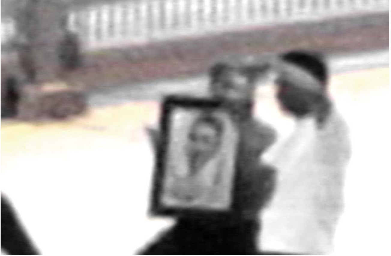
Public Domain #20 , 2004. Archival inkjet print. 20 x 30 in. Kevin Bruk Gallery, Miami. Dominio público #20 , 2004. Impresión chorro de tinta, calidad de archivo, Galería Kevin Bruk, Miami. 50,8 x .76, 2 cm.

1 The artwork's title is more geographically specific. It is borrowed from the colloquial term given to one of the favored kidnapping methods of the Colombian guerrillas. Translated to the English as "miraculous catch," the method consists of selecting hostages after doing on-the-spot database searches. And by on the spot I mean to say that this research happens all the while the potential hostages are being detained at the guerrilla's makeshift street blockades. If the guerrillas are able to determine the hostage's financial viability, they complete the kidnap by assigning a ransom based on the value of their capital. Aside from naming this method "pesca milagrosa" or "miraculous catch" in English, the miraculous catch is also considered by the guerrillas as the so-called revolutionary tax. For the artist, the title refers also to the methods used to make this work—image searches, appropriations and manipulations—and how such process linguistically resembles what he calls the roulette game of the guerrillas.