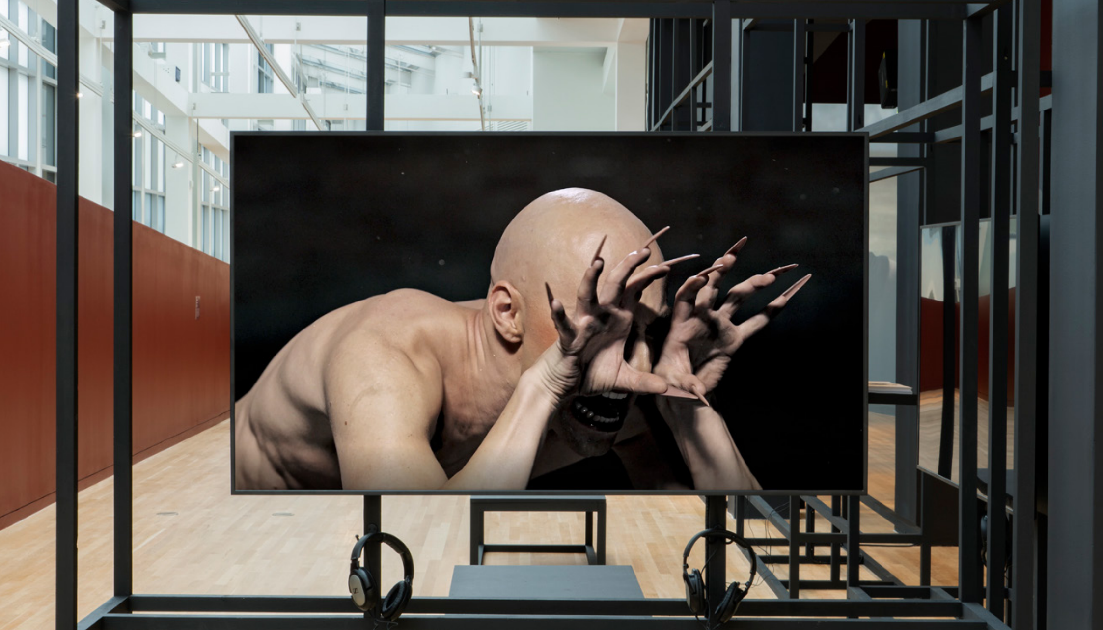
Carlos Motta: Your Monsters, Our Idols