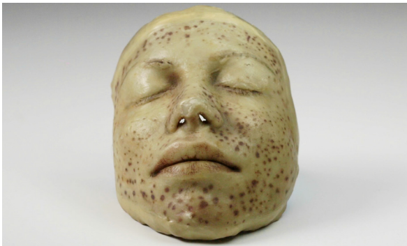
Colección Museo de Medicina de la Universidad Nacional de Colombia