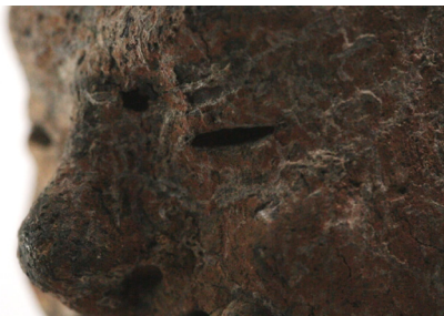
Colección Museo de Historia de la Medicina Ricardo Rueda González de la Academia Nacional de Medicina, Bogotá