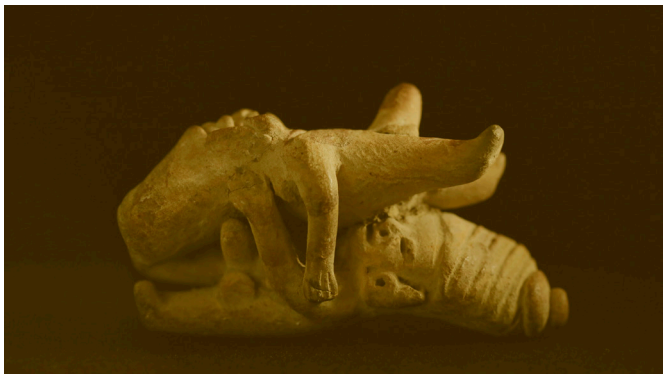
Colección de Hugo Sotomayor

CM ¿Podrías contarme un poco acerca de algunas de las representaciones que hablan del dolor? Tienes una figura por ejemplo que se está cubriendo los senos.